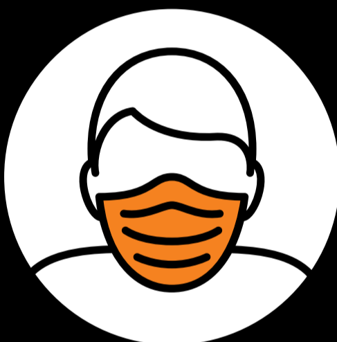
Empfehlung: Maske tragen, wenn Abstandhalten nicht möglich ist.