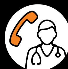
Nur nach telefonischer Anmeldung in Arztpraxis oder Notfallstation.