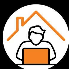
Falls möglich weiter im Homeoffice arbeiten.