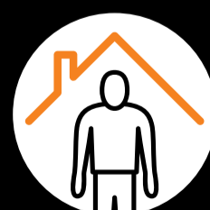
Bei Symptomen zuhause bleiben.