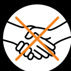
Hände schütteln vermeiden.