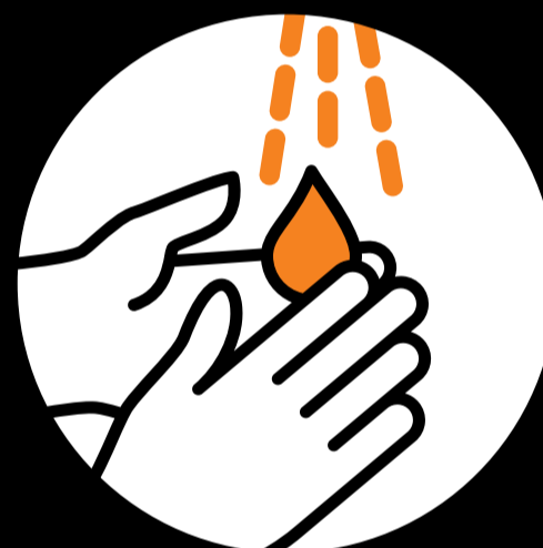
Gründlich Hände waschen.