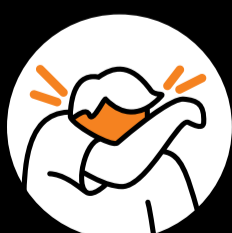
In Taschentuch oder Armbeuge husten und niesen.